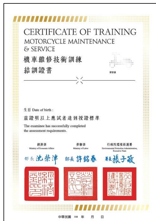
圖一 合格證書範例